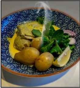
Exempel på lunch.